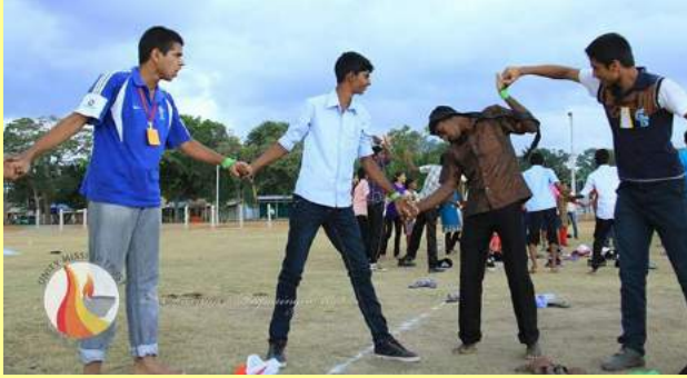
1 වැනි පිටුවෙන්.....

600 කට ආසන්න පිරිසකට නවාතැන් ගැනීමට, ආහාර පාන සපයා දීම සඳහා අවශ්‍ය පහසුකම් සකස් කිරීමට සහ කිලිනොච්චි වැනි ප්‍රදේශයක මෙවැනි කඳවුරක් සංවිධානය කිරීම සඳහා භාරයේ සියලු දෙනාටම තමන්ගේ විවේක කාලය කැප කිරීමට සිදුවිය. යුනිට් මිෂන් භාරය ස්වේච්ඡා සංවිධානයක් වන අතර, දිවා රැ නොබලා සේවය