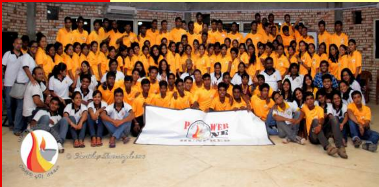
SHANTI MISSION SRI LANKA