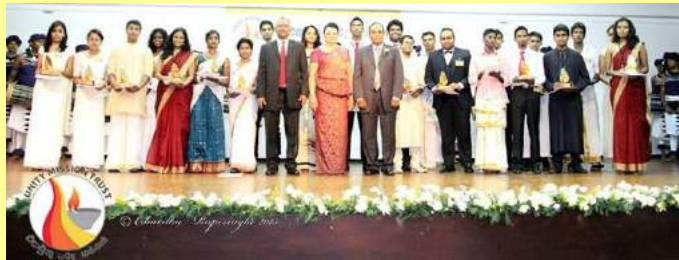
ජාතික එකමුතුකම සහ සහයෝගීතාවය සඳහා වන සම්මානය ලැබීය UMT නිර්මාතෘ, ප්‍රධාන අමුත්තිය සහ භාරකාර සභාපතිද සඳහා

බලාපොරොත්තුවේ අරුණාලේ 02' සහ 'ජාතික එකමුතුකම සහ සහයෝගීතාවය සඳහා වන සම්මාන උළෙල