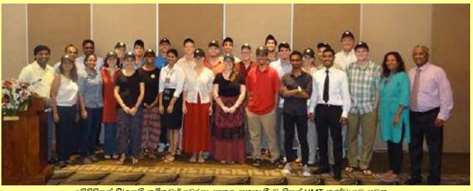
ඩේවිඩ්සන් විද්‍යාලී කාර්යාලයේ පැවැත්වූ සිසුන් UMT කාර්යාලය සමඟ