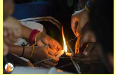
6 වැනි එකමුතු කඳවුර 'කිඳිගොවිවිය එක් දැල්ලක ආලෝකය දහසක් දැල් දැල්වුවාය

මුදල්/ වෙබ්පත් බැර කිරීම : Ekamuthu Oray Makkal Unity Mission Trust / බැංකුව : මහජන බැංකුව/ ගිණුම් අංකය 014100180004373 /