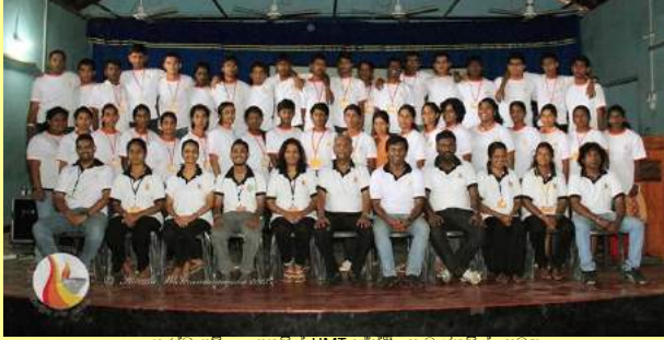
කණ්ඩායම නායකයන් UMT ශ්‍රේණි සාමාජිකයන් සමඟ