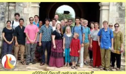
ඩේවිඩ්සන් විද්‍යාලී කාර්යාලය යාපනයේ

සාකච්ඡා කළ කරුණු බොහෝමයක් අධ්‍යාපනය සහ යුනිටි මිෂන් භාරයේ අනාගත ව්‍යාපෘති පිළිබඳව විය. මෙහිදී මූල්‍යම අපහසුතා ඇති සිසුන්ගේ අධ්‍යාපන කටයුතු නැරඹීමට සහ වඩාත් හොඳ ඉගෙනීම වටපිටාවක් ඇති කිරීම සඳහා සිසුන් හා ගුරුවරුන් අතර සම්බන්ධතාවය වැඩි කිරීමේ අදහස ඇතිව ගුරුවරුන් සඳහා පුහුණු වැඩමුළු පැවැත්වීමේ හැකියාවන් ද සලකා බැලිනි. උසස් පෙළ අවසන් කළ සිසුන්ට ඇති ප්‍රධානම බාධකය වන්නේ තෘතික අධ්‍යාපනය කරා යොමුවීම වෙනුවෙන් ඔවුන්ට ඇති විවිධ අවස්ථා පිළිබඳ දැනුම අඩුකමයි. මෙම ගැටළුව නිරාකරණය කිරීම සඳහා උසස් අධ්‍යාපන වැඩමුළු සහ පුද්ගලික උපදේශන සැසි පිළිබඳ අවධානය යොමුවිය. තෝරාගත් සිසුන් සඳහා ශිෂ්‍යත්ව වැඩසටහන් පිළිබඳව ද මෙහිදී සාකච්ඡා කෙරිණි.