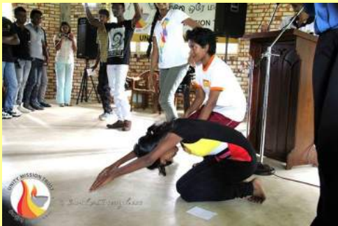
SHANTI MISSION SRI LANKA

POH සඳහා විශේෂ ආරාධනාවන් පිළිගෙන පැමිණි කැරිකයින්